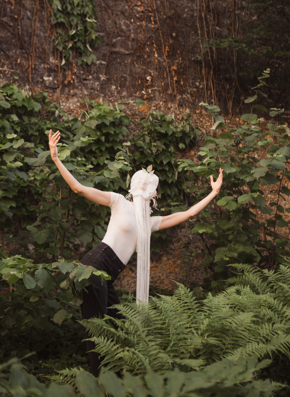
Blessed , 2018, Festival Parcours Saint Germain, Musée National Eugène-Delacroix, Paris, FR