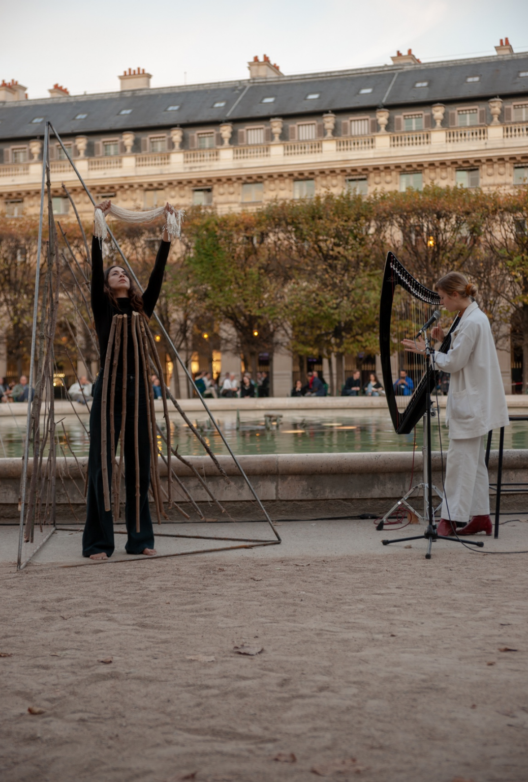
Arpa , 2018, performative installation, Carré Latin, Latin American Contemporary Arts Festival, Paris, FR