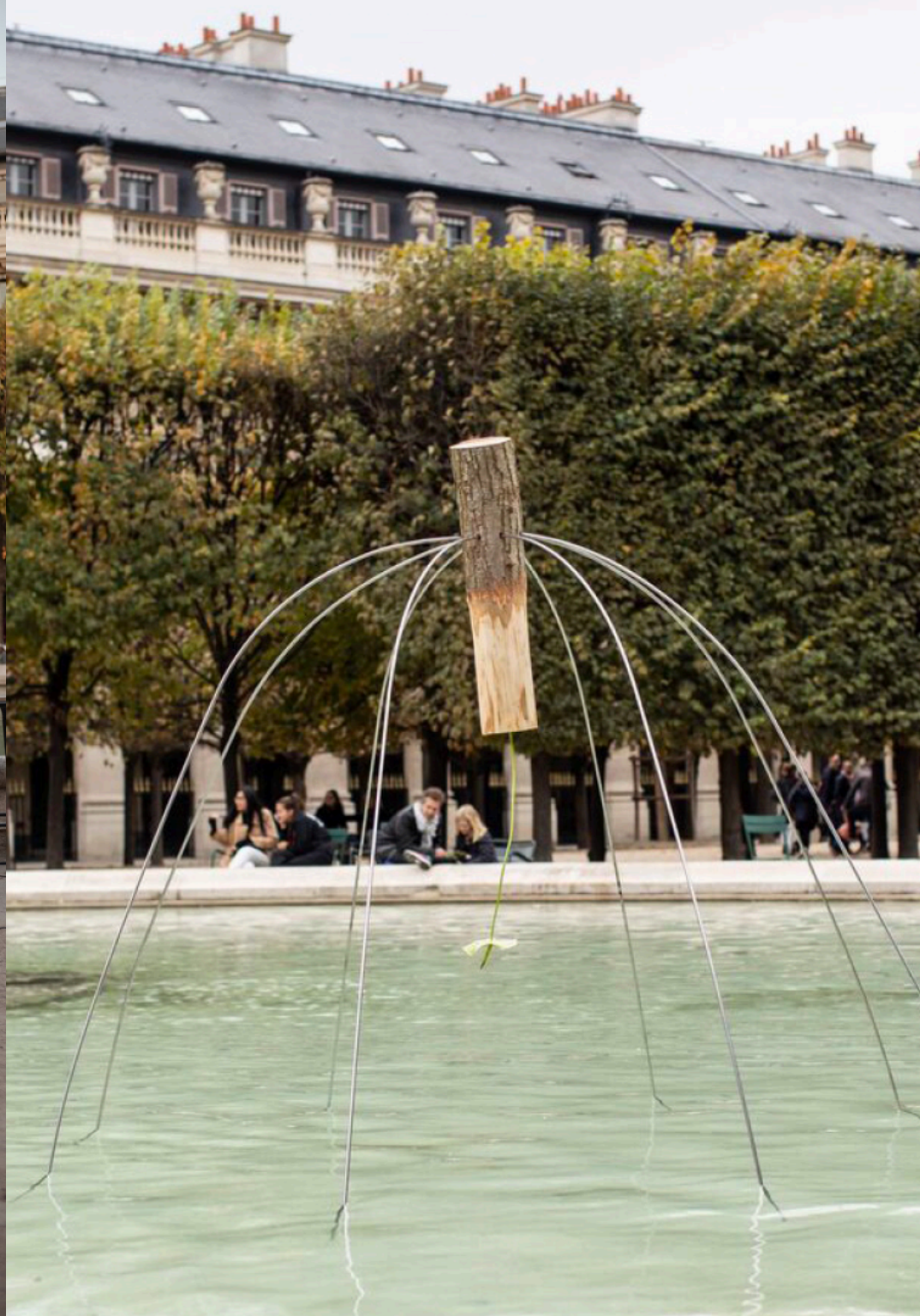
Hydra Gossamer , 2018, wood, steel, anthurium, Carré Latin, Latin American Contemporary Arts Festival, Paris, FR