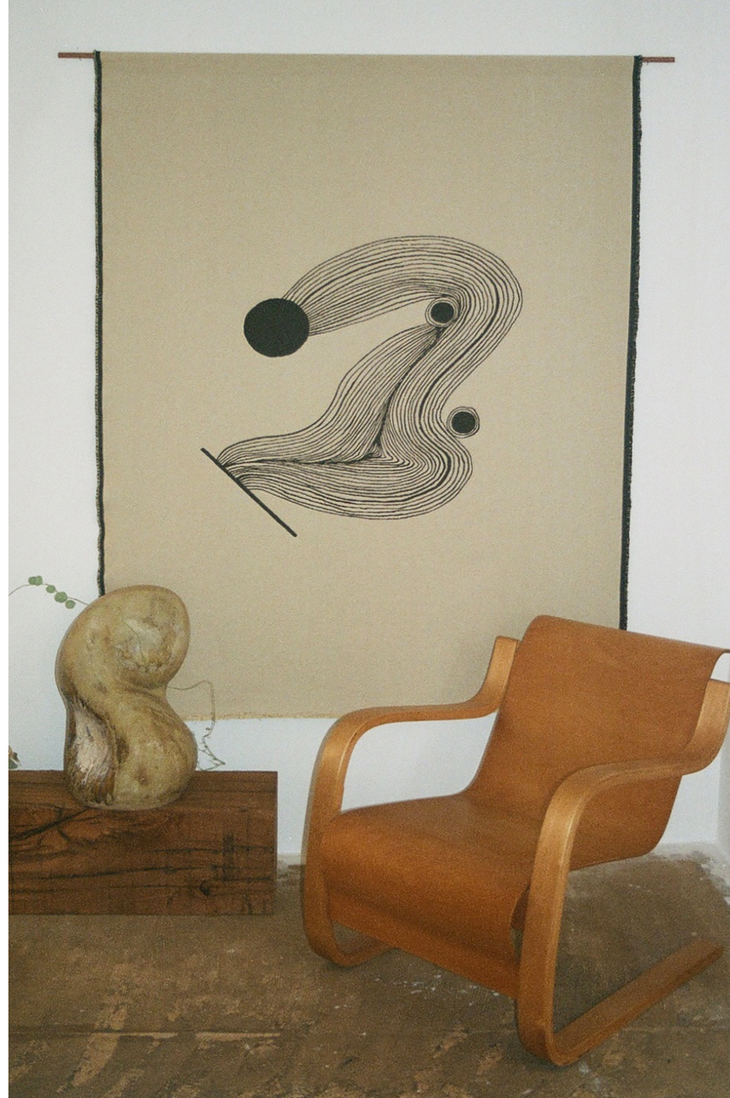
Points of contact , 2020, handwoven tapestry