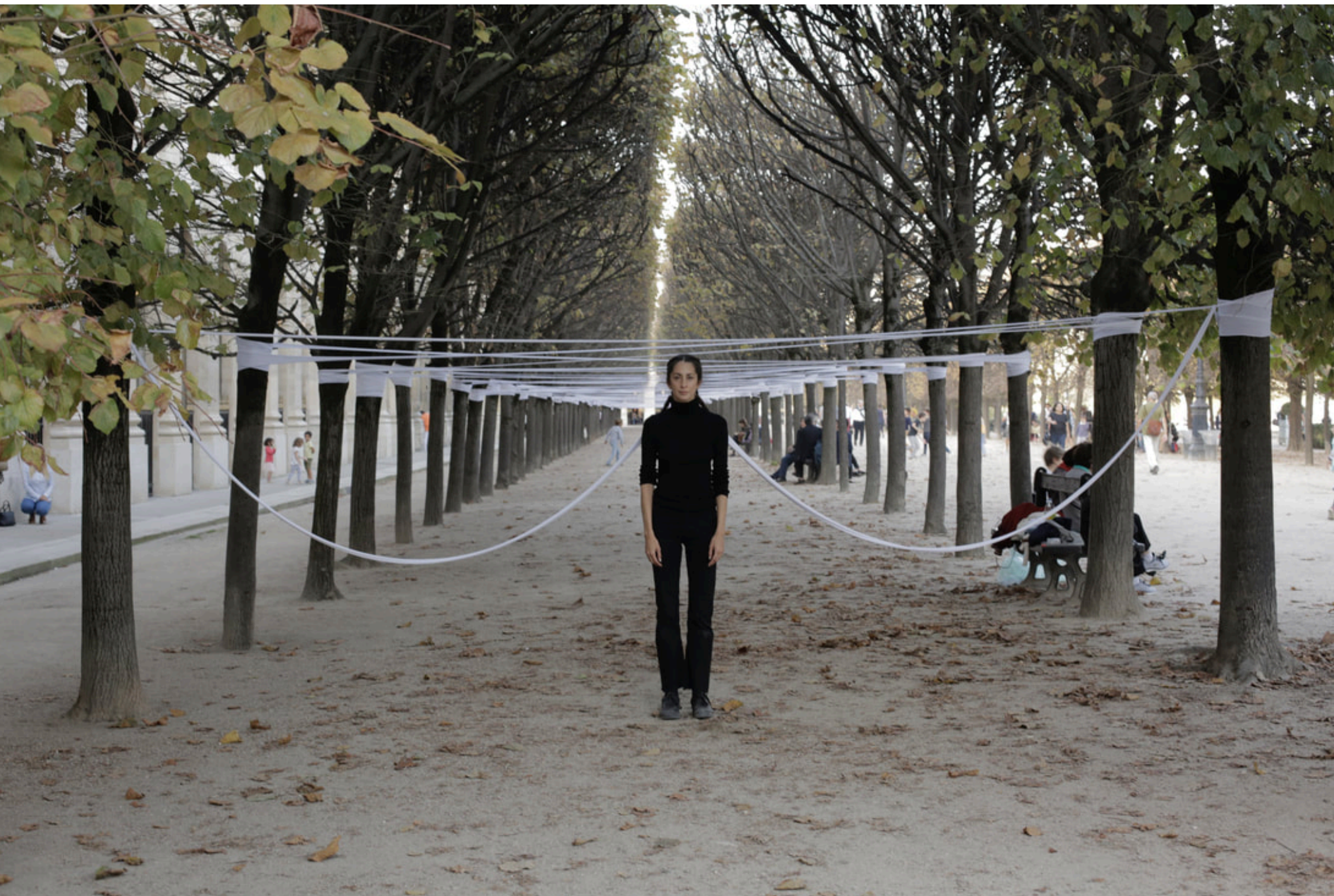
Webmaking Ritual II , 2017, performative installation in Palais Royal, Carré Latin Festival, Paris, FR.