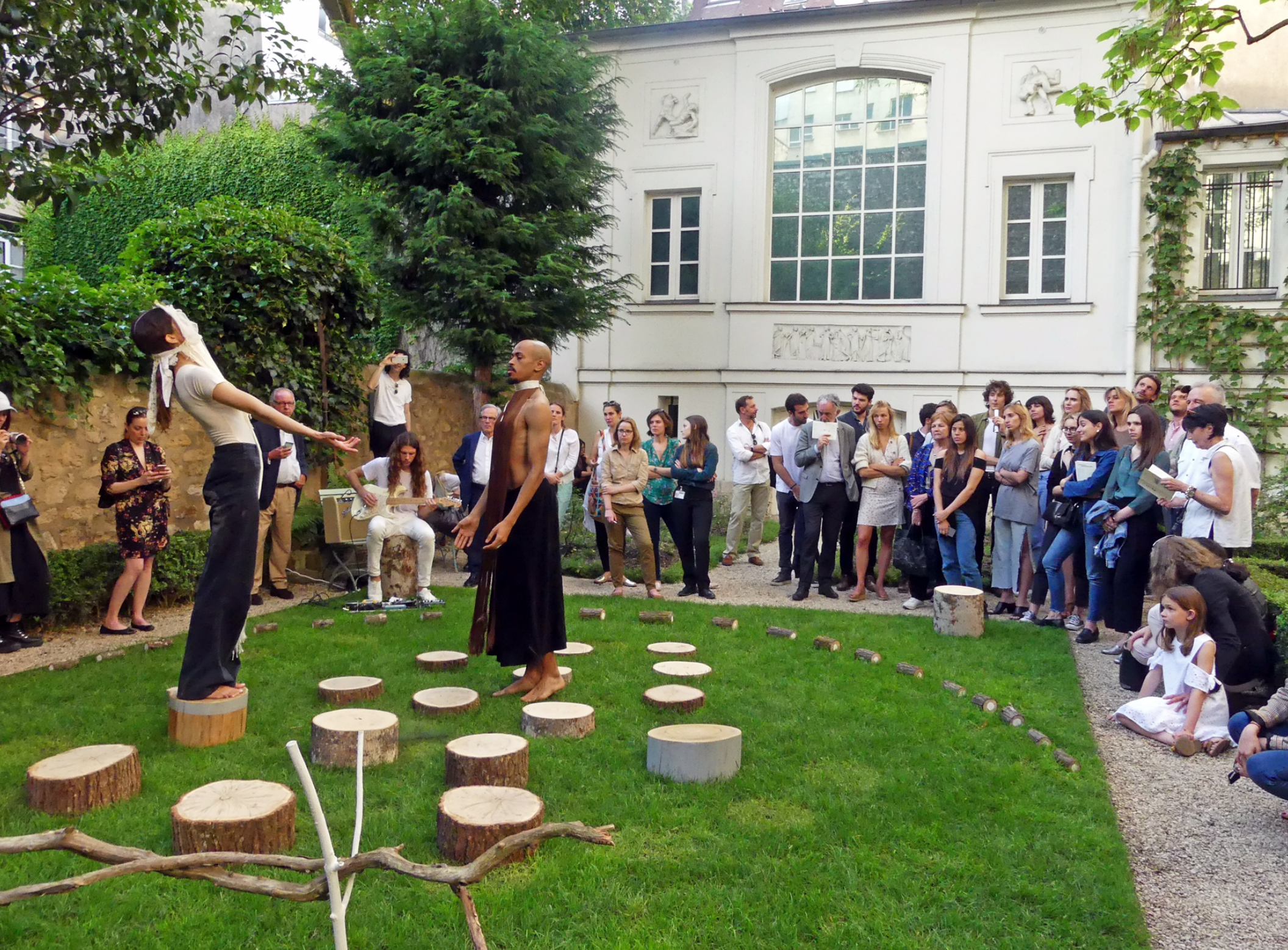
Blessed , 2018, Festival Parcours Saint Germain, Musée National Eugène-Delacroix, Paris, FR