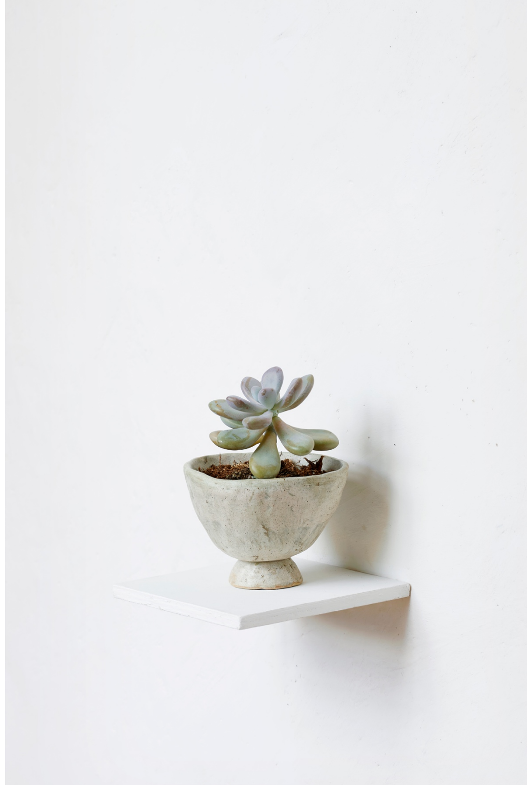
Sans titre , 2020, moonstone plant, ceramic pot made with earth from the Pyramid of the Moon in Teotihuacan