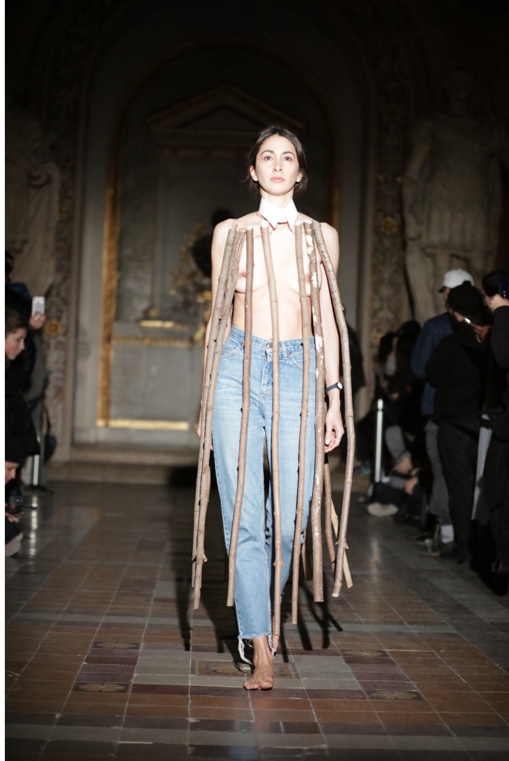
Tree Dress , 2017, École nationale supérieure des beaux-arts, Paris, FR