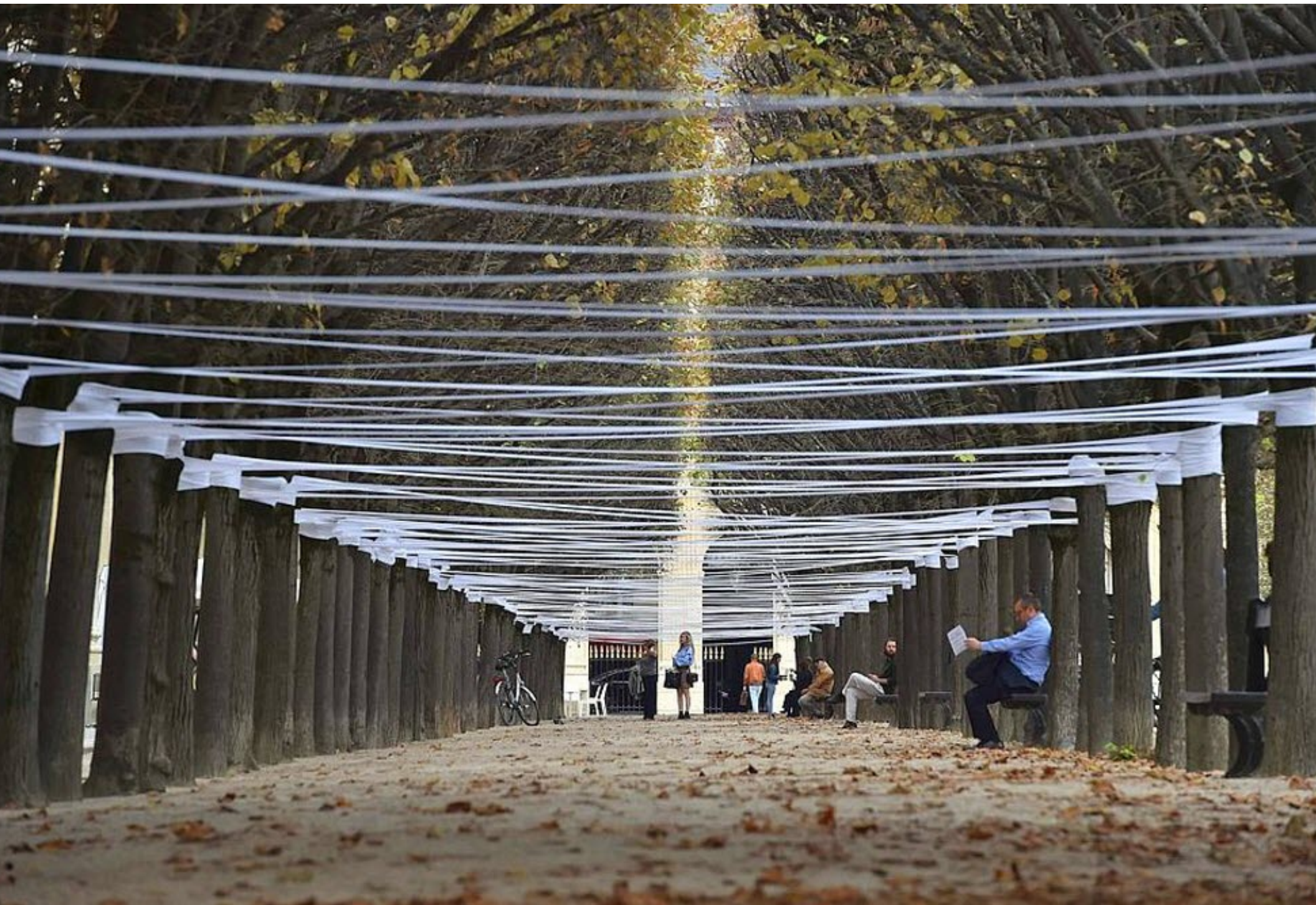
Webmaking Ritual II , 2017, performative installation in Palais Royal, Carré Latin Festival, Paris, FR.