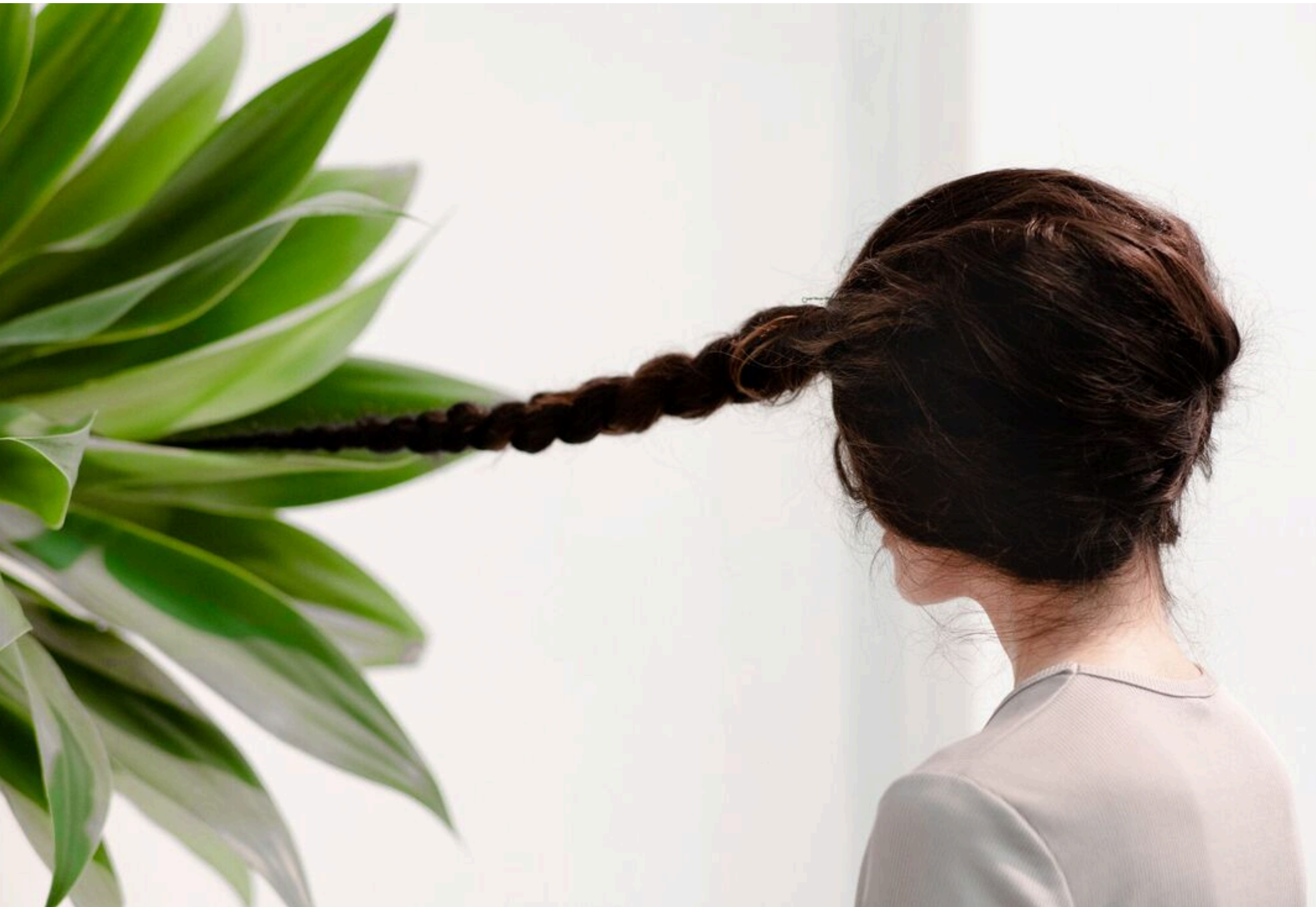
Tsaheyly , 2019, Como falar com as árvores , cur. Lilian Franji, Galerie Z42, Rio de Janeiro, BR