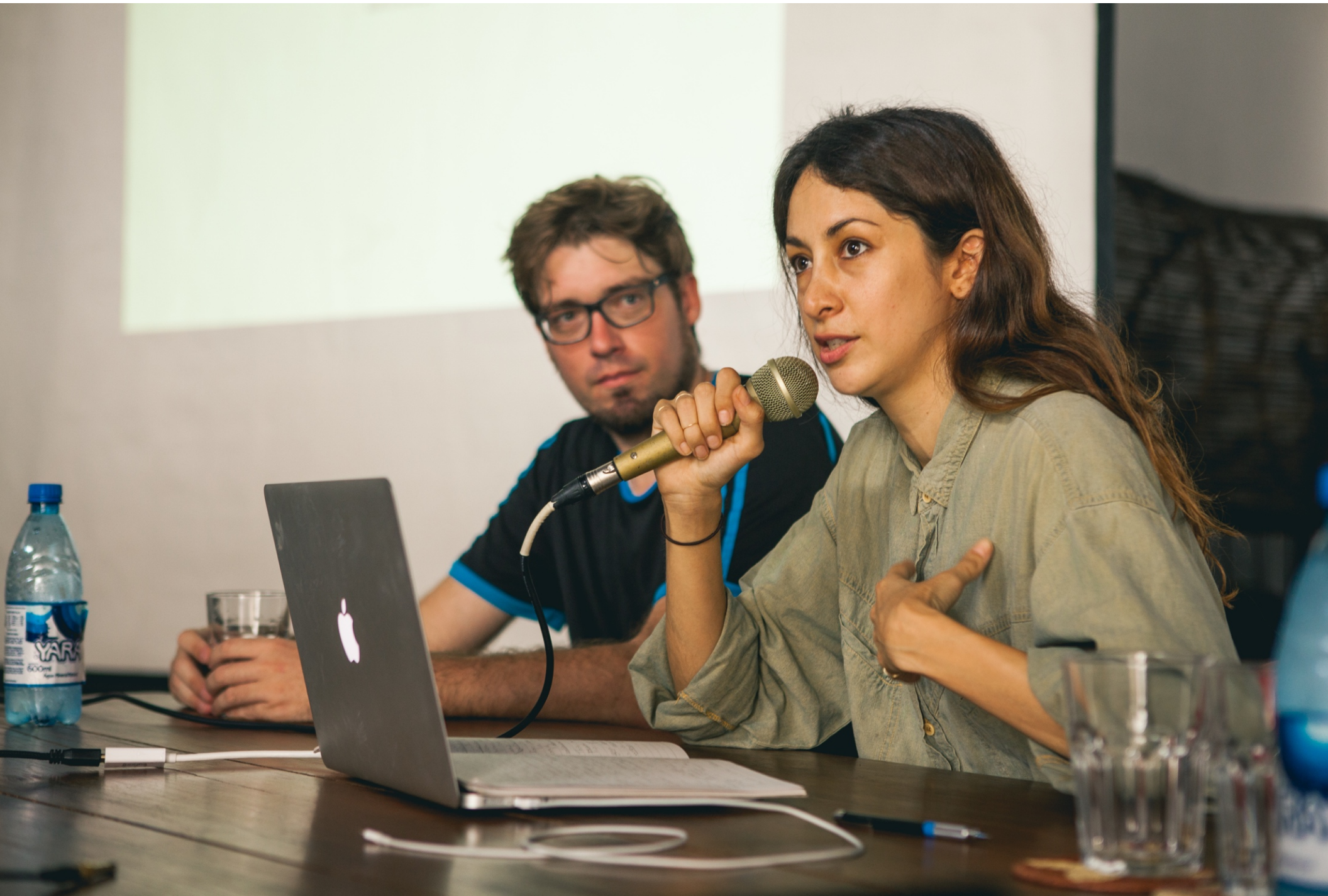
Conference at the residency program LAB Verde, 2017, Manaus, BR