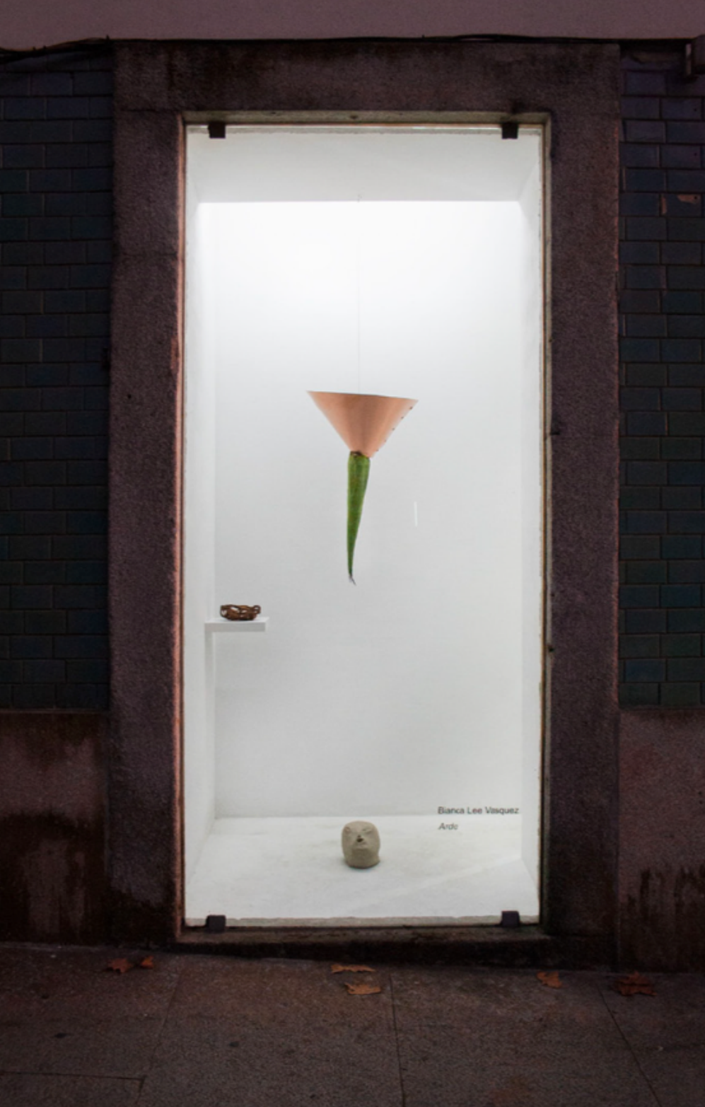
Arde (solo show), 2019, Kubik Gallery / Kubikulo, Porto, PT