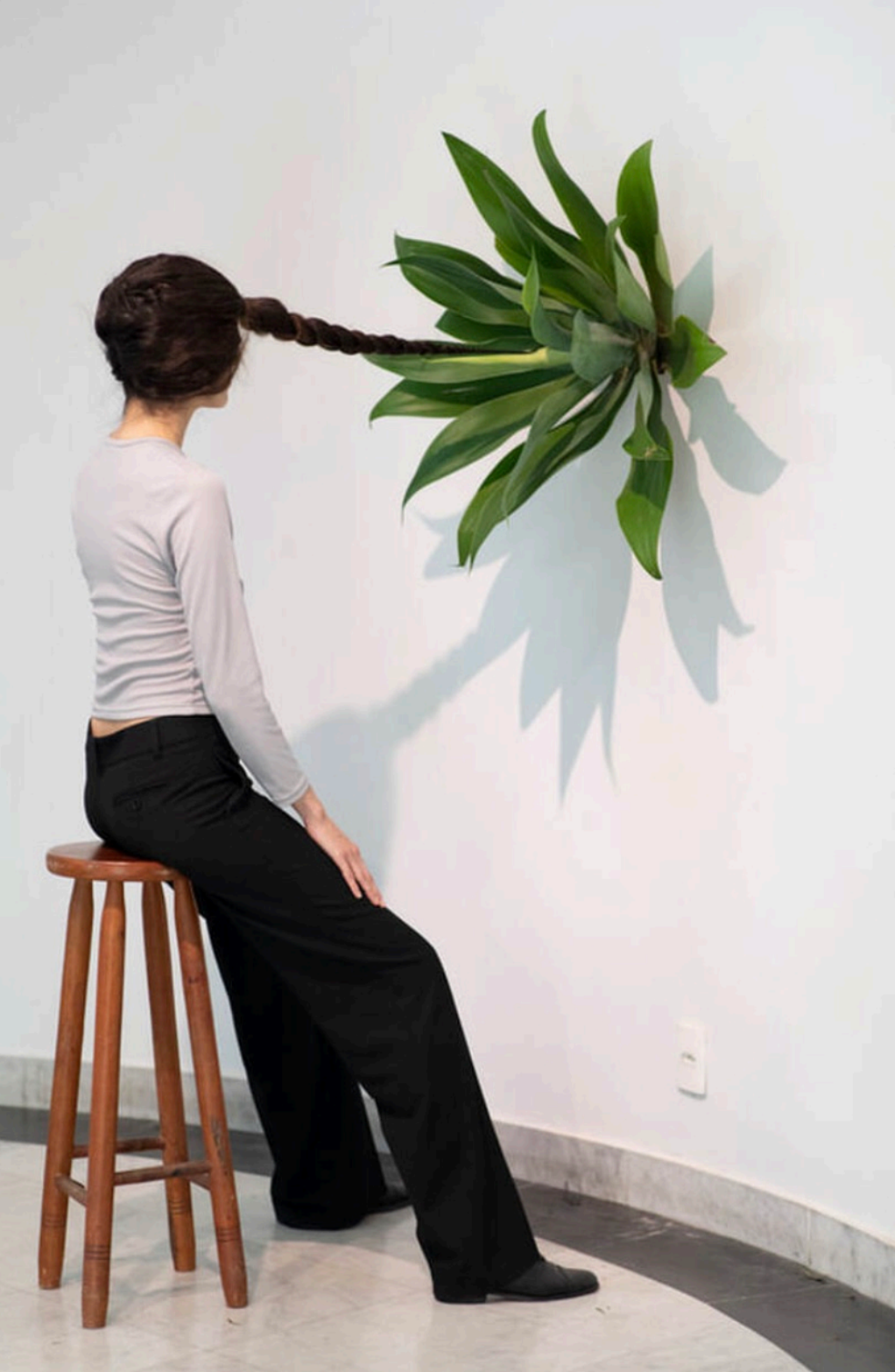
Tsahey lu , 2019, Como falar com as árvores , cur. Lilian Franji, Galeria Z42, Rio de Janeiro, BR