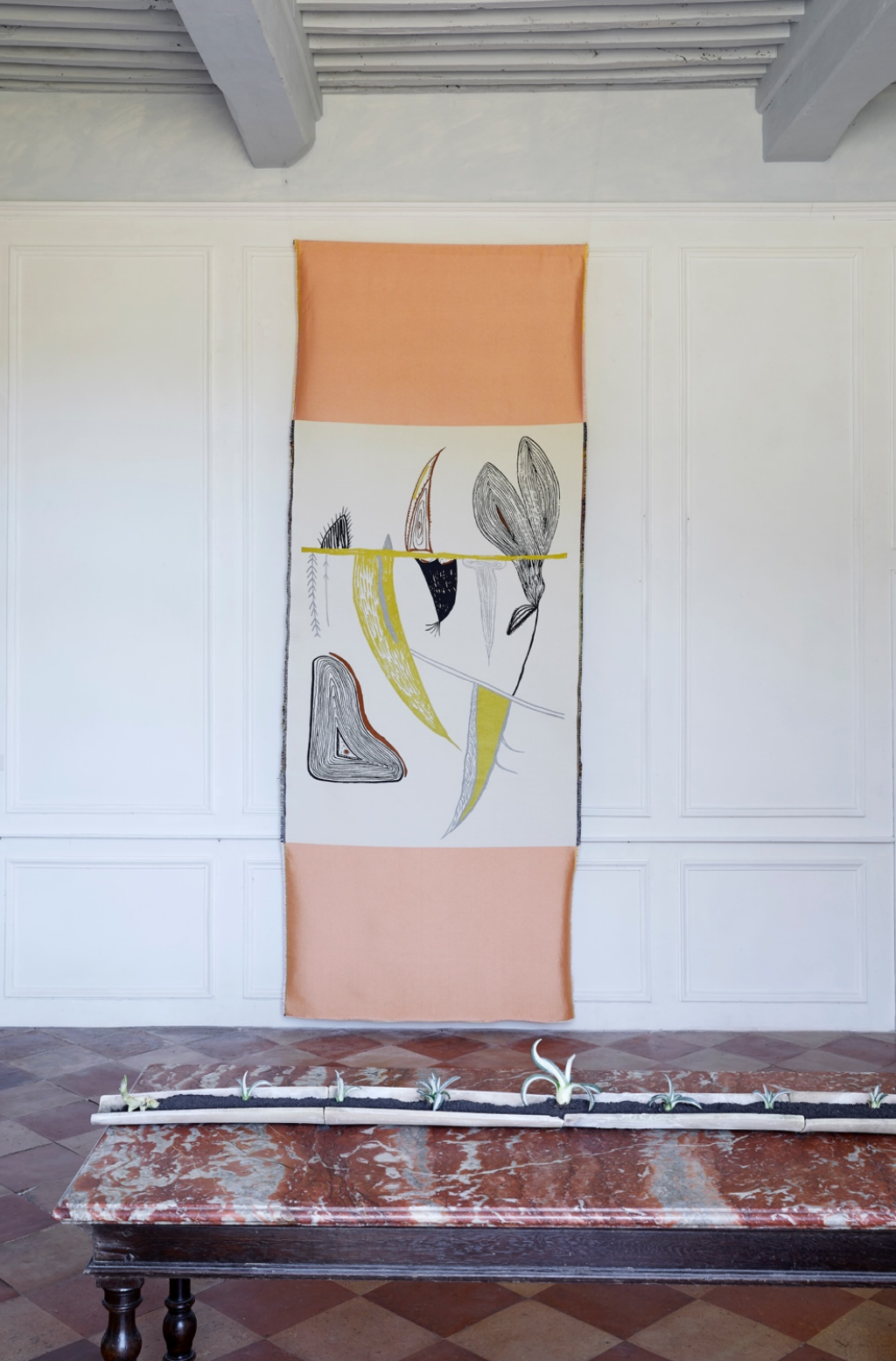
Split Spikes Garden , 2020, handwoven tapestry